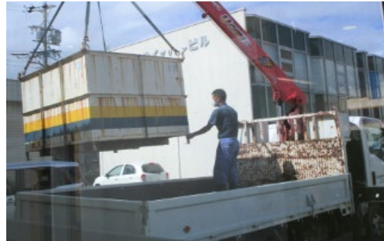
産廃BOXで大型のゴミを一度に廃棄できた