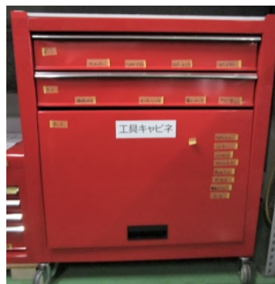
仮表示のままになっている