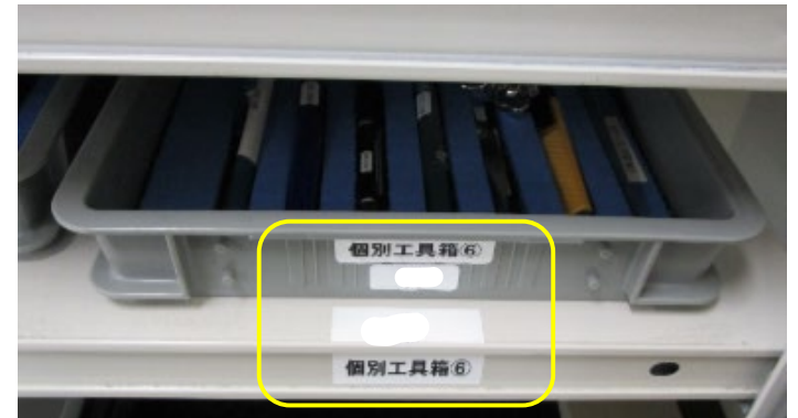
工具箱を管理する担当者としての名前表示