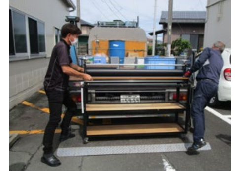
金属ゴミでパネローラーを回収依頼