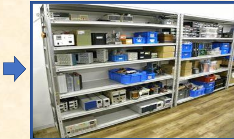
計測器・電源の重ね置きをなくした