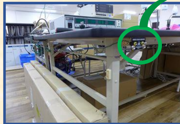
アースターミナル取付