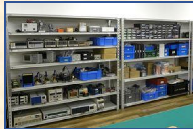
使用頻度を考慮し場所移動、定位置化検討中