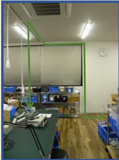
壁のコンセントのアースから 実験室机までの配線