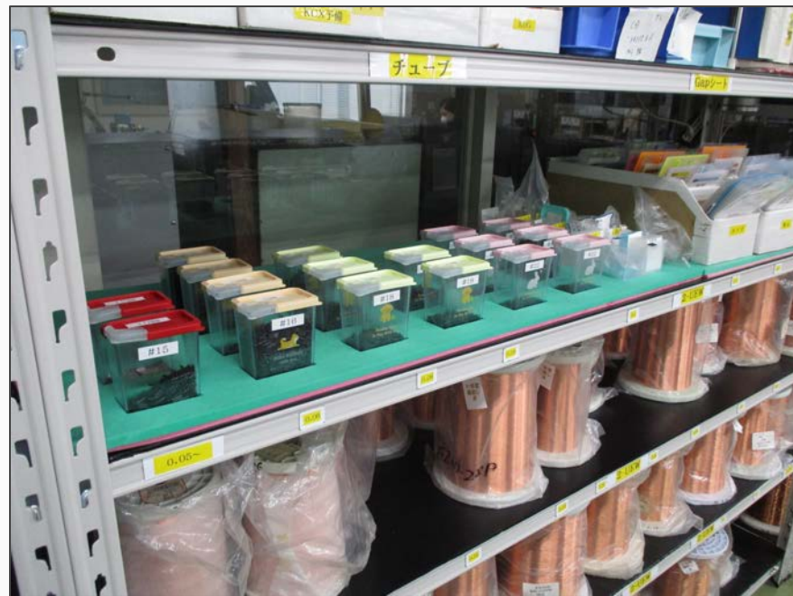
チューブ部材の姿置き