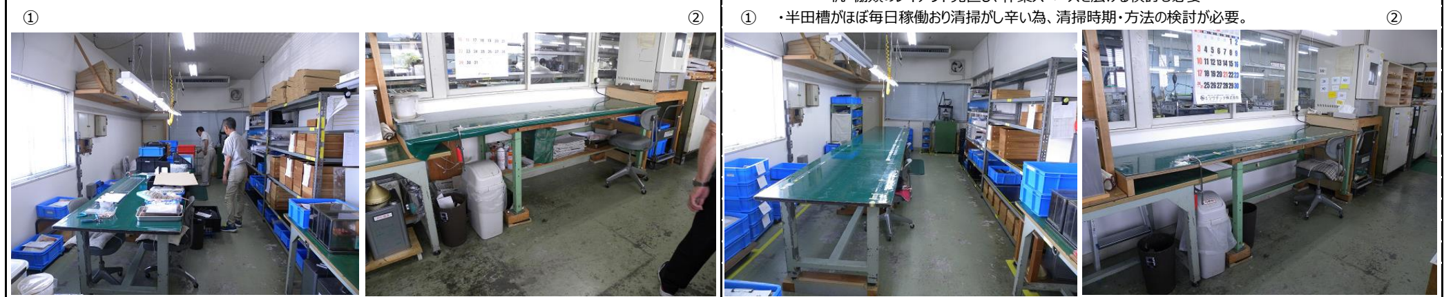
① 不要・不急品も含め、乱雑に置かれている ② 半田槽が直置きで、半田カスが設備内にこぼれ、清掃し辛い。 ③ ④

棚の上・作業机の下に材料やコンテナ類が乱雑に置かれ、全体的に手狭感も有り。 概ね整理・整頓したが、一部不十分箇所有り。 ・木箱類、コンテナBOXの数量過多（もう少し一時保管出来る場所の確保が必要） 机・棚類のレイアウト見直し、作業スペースを広げる検討も必要